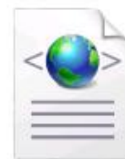
Faktura w JPK_FA

Znajdziesz je w pliku, którego adres wyświetla się w oknie konfiguracji, gdzie możesz również wyznaczyć własny folder na faktury. Okno konfiguracji pokazuje również w jakich formatach faktury są ściągane na Twój dysk z serwera PrzyjaznejFaktury!